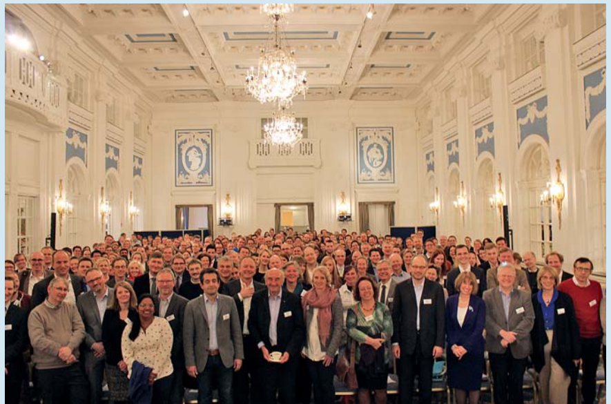
4. DZL-Jahrestreffen im Hotel Atlantic Kempinski in Hamburg.